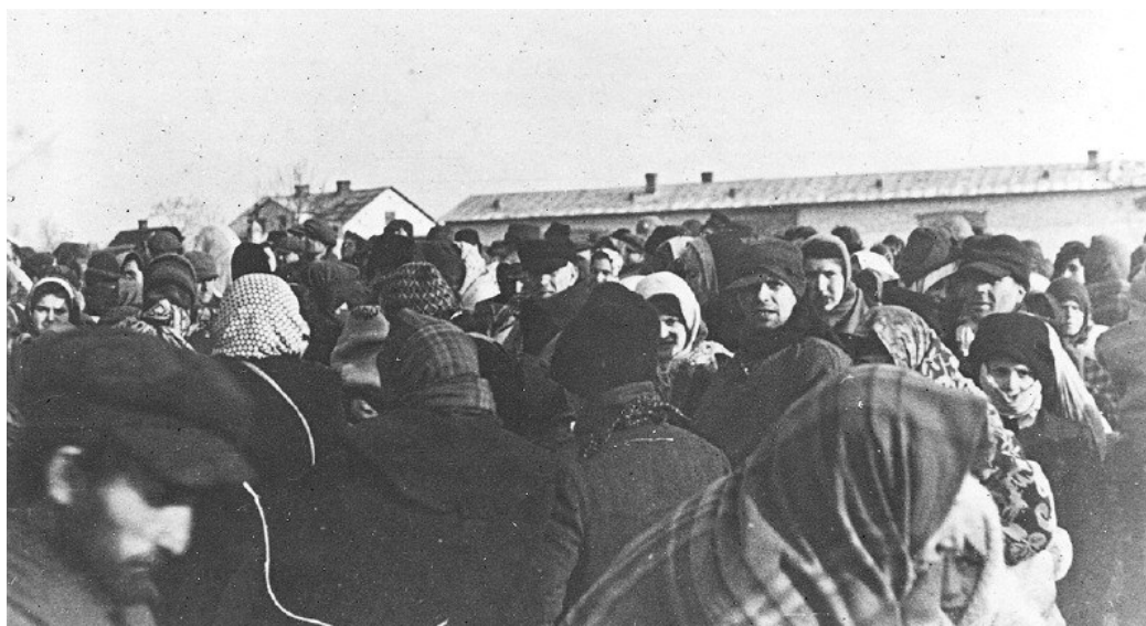
יהודים מגטו זמושץ' שרוכזו לפני גירושם בשנת 1942 [6]

למחרת צאתה של הרכבת הבהילו הגרמנים כבאים פולנים מן הכפרים הסמוכים והללו הלכו מבית יהודי למשנהו כשהם מצוידים בקרדומות ובמזנקי-מים. הפולנים הקישו בקרדומות על כל קיר ורצפה וכשנתגלו בהם חלוליות – פרצו את המקום בכלי המשחית שלהם והזרימו לתוכו סילוני-מים במזנקים שלהם. עברו דקות ספורות ומתוך המחבואים הגיחו יהודים רטובים וחיוורים כסיד, מפחד וחלחלה. הכבאים הפולנים קיבלו יהודים אלה ברעמי צחוק, היכו אותם עד זוב דם, הריקו כיסיהם והובילום לבית הקולנוע באיזביצה, ששימש מקום מעצר לניצודים. מאות יהודים נדחקו לתוך בניין הקולנוע הצר והוחזקו במשך שמונה ימים ללא מאכל ומשקה ואפילו לעשיית צרכים לא ניתן להם לצאת. כעבור שבוע ימים הוצאו הכלואים קבוצות-קבוצות בנות 30-40 איש והובלו לבית הקברות היהודי באיזביצה ושם נרצחו כולם בריות. [7]