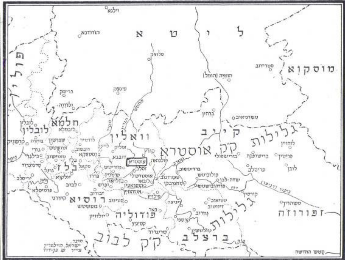
מיקומה של אוסטרא במפה [2]