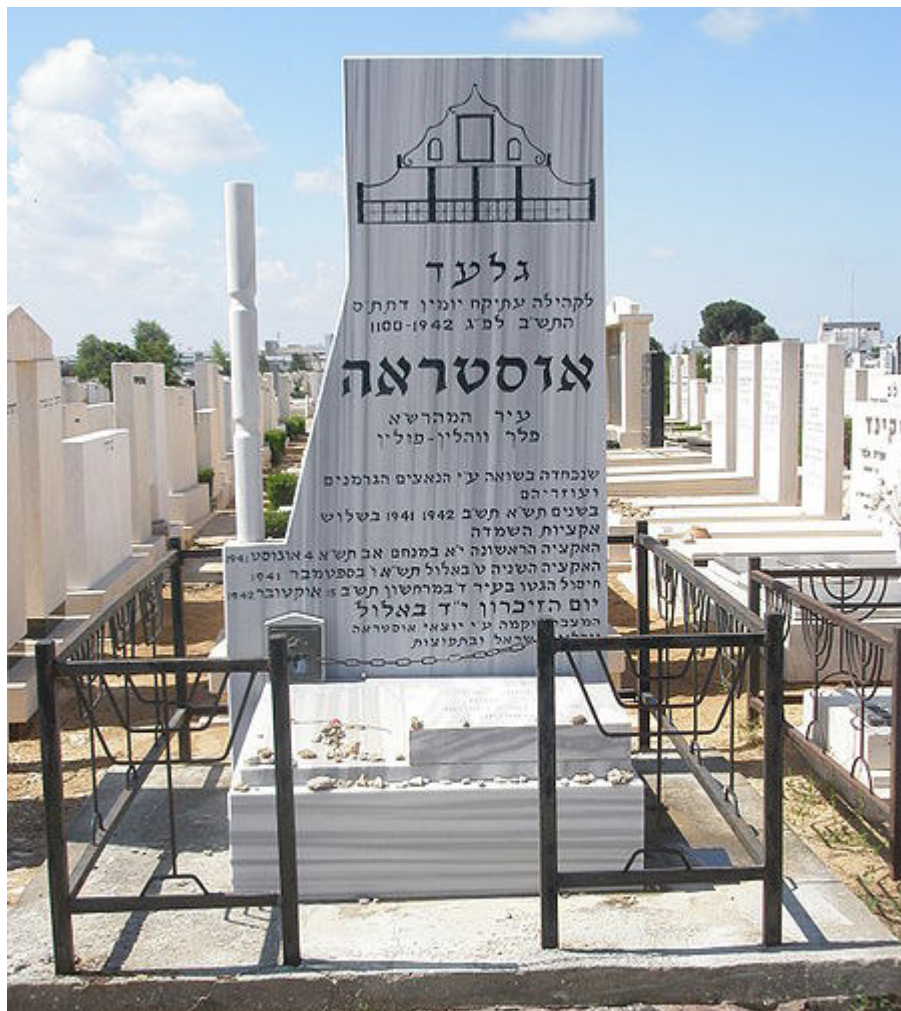
מצבה לקהילת אוסטראה בבית העלמין בחולון [1]