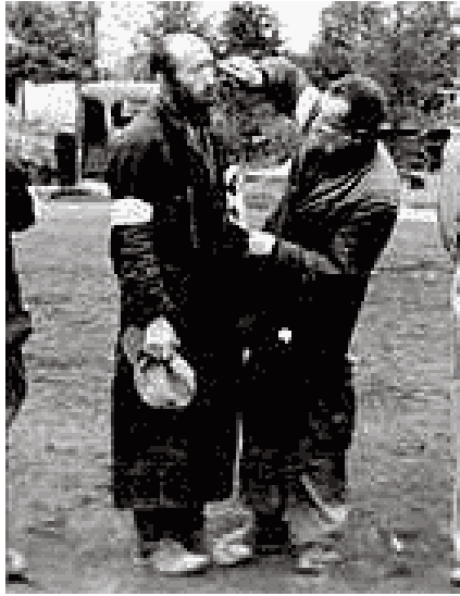
גילוח זקנו של יהודי בזמושץ' [10]