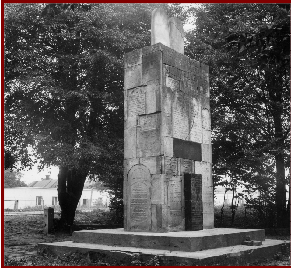
המצבה בבית הקברות בזמושץ' [5]

מצבה זו הוקמה בשנת 1950 לזכרם של 14,000 יהודי זמושץ' שנרצחו בשואה ונמצאת בבית הקברות בזמושץ'. לבנין המצבה השתמשו באבני מצבות שבורות של קברים מחוללים שנאספו ממקומות שונים בעיר.