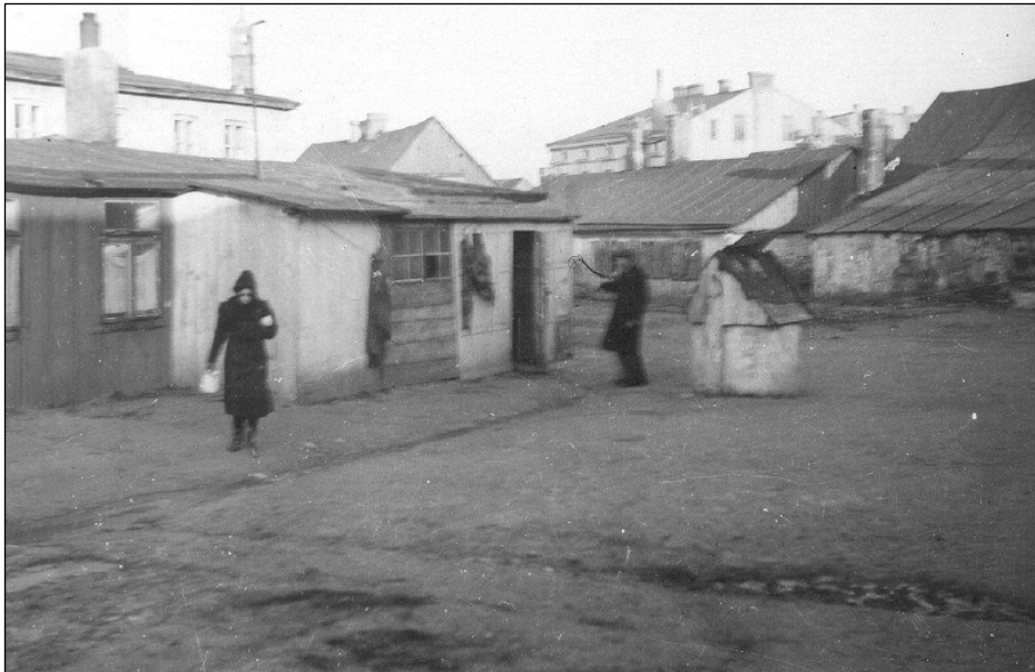
רחוב בגטו זמושץ' [5]