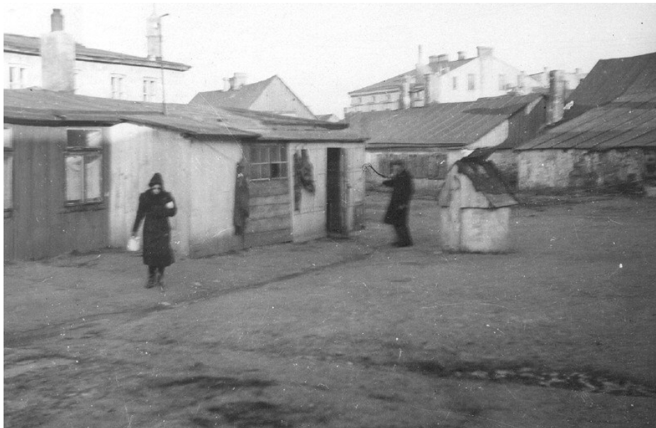
רחוב בגטו זמושץ' [6]

- עזור לי לארוז "חבילה" קטנה אחת... האחות הבכירה הינדה השקיטה בנועם דבריה את שתי האחיות הקטנות, שבכו אף הן. רק עתה ייסרתי את עצמי: "מה עשיתי? למה אמרתי להם שירדו מעליית-הגג? בין כך ובין כך לא יינצלו מאבדון." - יענקלי, שאלני אבי, הלקחת איתך את התפילין שלך? למען השם, אל תשכח לקחתם איתך! - מהרו, שקים בלים! – צרח הזקיף בעד החלון. אבא לחש בחיפזון תפילה, יישר את קומתו אמיצות ושאל: ובכן, ילדים, כולנו מוכנים? הוא התקרב הראשון לדלת, נשק שלוש פעמים את המזוזה וביקשנו שנעשה כמוהו, קשה היה להזיז את אמא המתייפחת בבכי. - אל ייאוש, ילדים! – ניחם אותנו אבא – בעיניכם תראו כי השם יתברך יהיה בעזרנו.